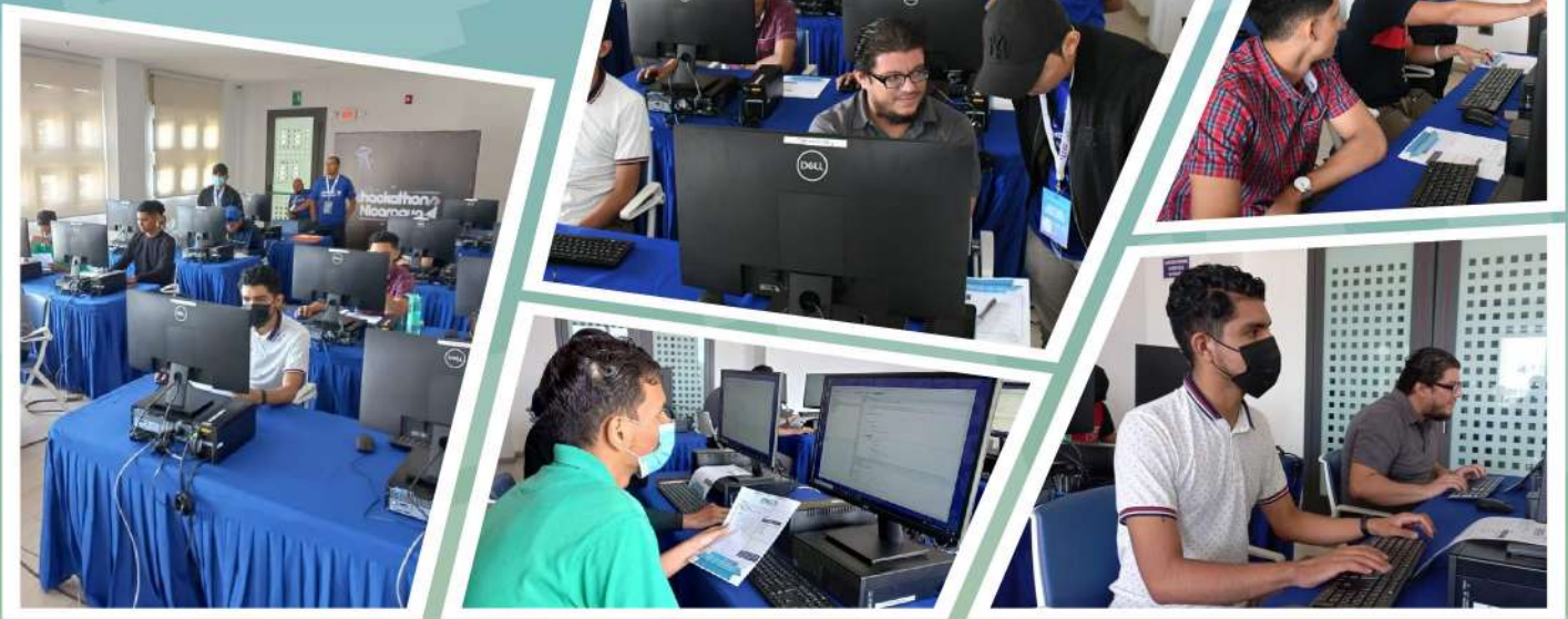
Box Puzzle Challenge Programación, por Luis Martínez.